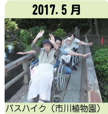
2017. 5月 バスハイク(市川植物園)