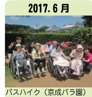
2017. 6月 バスハイク(京成バラ園)