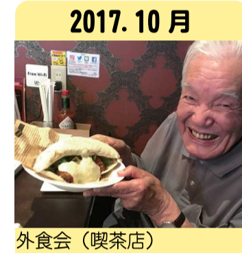
2017. 10月 外食会(喫茶店)