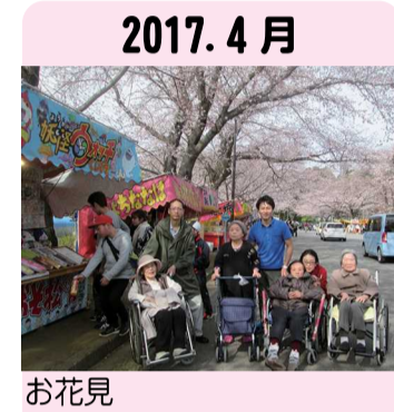
2017. 4月 お花見