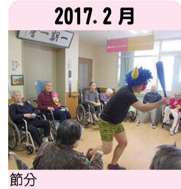
2017. 2月 節分