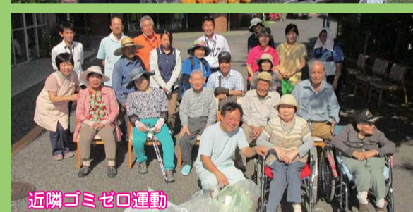
近隣ゴミゼロ運動