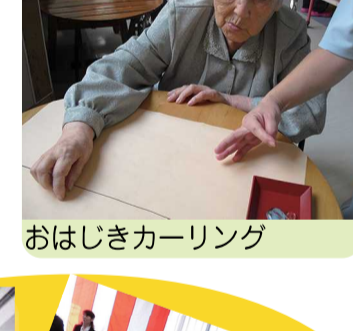
おはじきカーリング