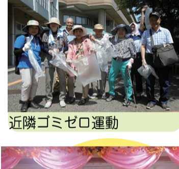
近隣ゴミゼロ運動