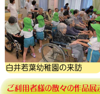
白井若葉幼稚園の来訪