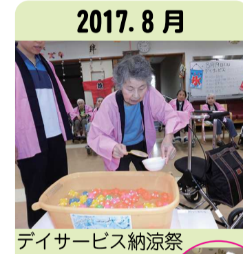
2017. 8月 デイサービス納涼祭