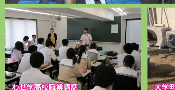
わせ学高校職業講話