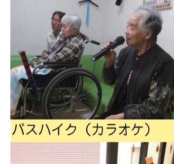
バスハイク(カラオケ)