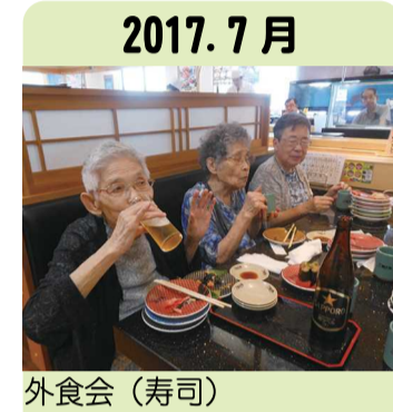
2017. 7月 外食会(寿司)