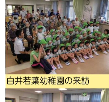
白井若葉幼稚園の来訪