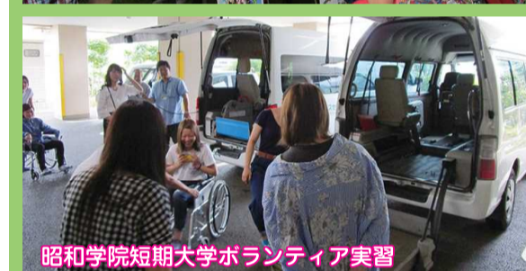
昭和学院短期大学ボランティア実習