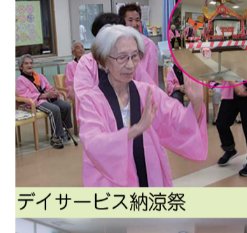
デイサービス納涼祭