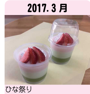
2017. 3月 ひな祭り