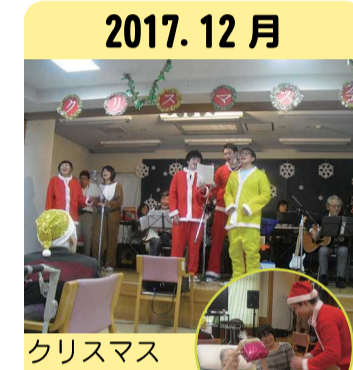
2017. 12月 クリスマス