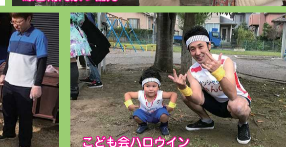
ことも会ハロウィン

かすみ草の活動は、地域の方々の声を聴きながら実施しています。これからも地域の一員として、地域貢献活動を行っていききたいと思います。