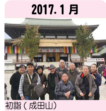
2017. 1月 初詣(成田山)