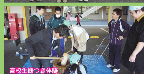
高校生餅つき体験