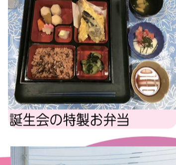
誕生会の特製お弁当