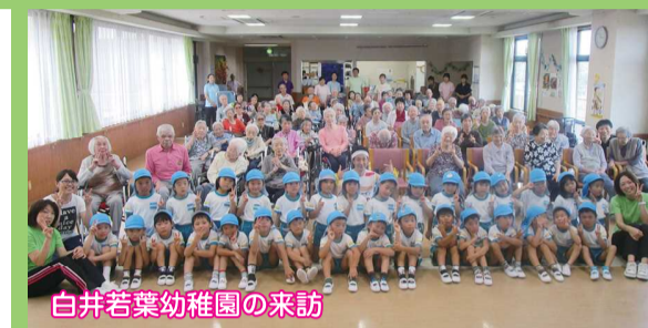
白井若葉幼稚園の来訪