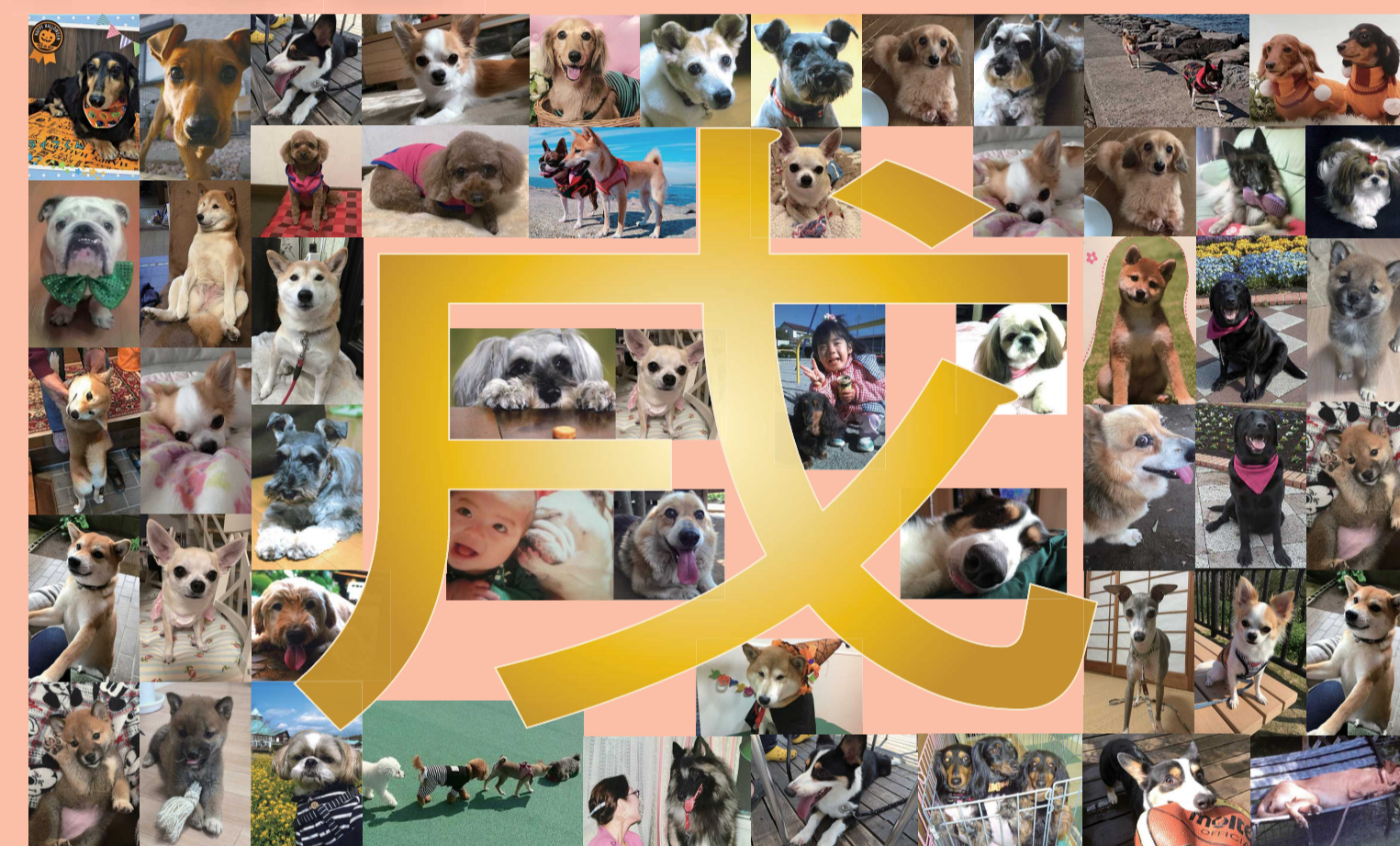
ワンちゃんの写真を提供して頂いた皆様、ありがとうございました。

元気を応援します 社会福祉法人 清明会 発行: 特別養護老人ホームはなみずき ショートステイはなみずき デイサービスセンターはなみずき 在宅介護支援センターはなみずき ヘルパーステーションはなみずき ケアハウス りんどう ケアハウス ガーデンカルミア 地域交流センターかすみ草 八千代市高津・緑が丘地域包括支援センター 広報担当: 瀬野 電話 047-480-5050 〒278-0004 千葉県八千代市島田台 988-4 ホームページ: http://seimeikai-hanamizuki.com/ Eメール: hana-seimeikai@luck.ocn.ne.jp