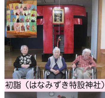
初詣(はなみずき特設神社)