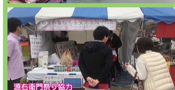
源右衛門祭り協力