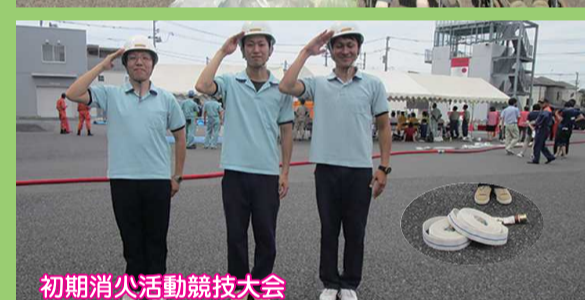
初期消火活動競技大会