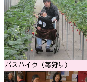
バスハイク(樽狩り)