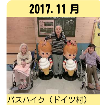
2017. 11月 バスハイク(ドイツ村)