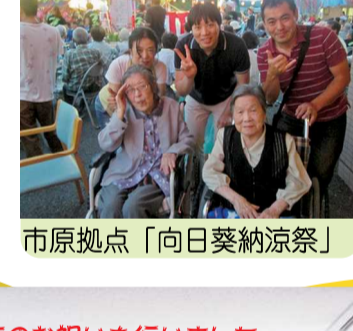
市原拠点「向日葵納涼祭」