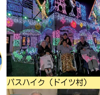
バスハイク(ドイツ村)