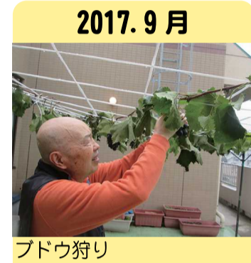
2017. 9月 ブドウ狩り