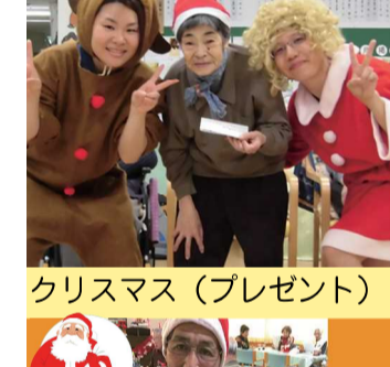
クリスマス(プレゼント)