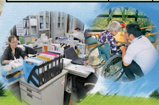
在宅介護支援センター(居宅支援)