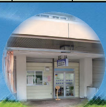
地域包括支援センター