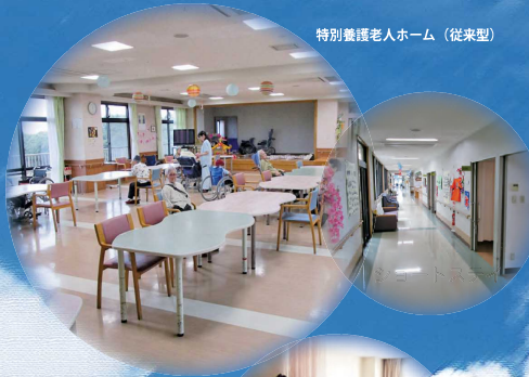
特別養護老人ホーム（従来型）