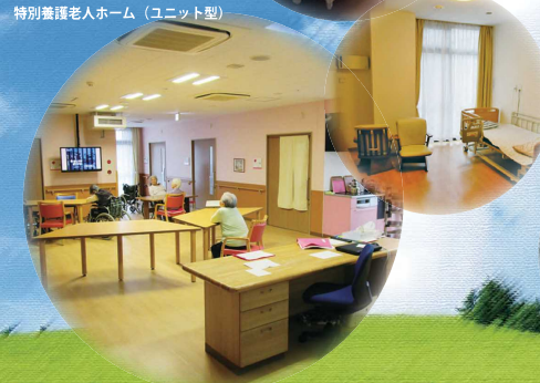
特別養護老人ホーム（ユニット型）