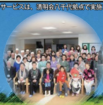
地域交流センター