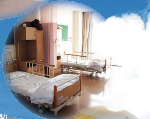
ショートステイ (短期入所生活介護)