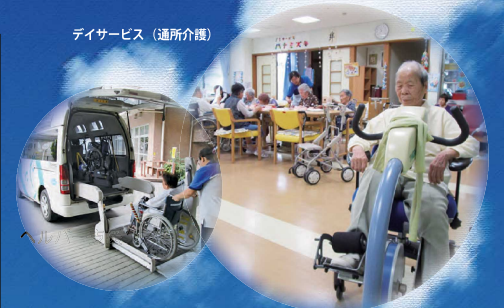
デイサービス（通所介護）

※表記のサービスは、清明会八千代拠点で実施しているものを一例として記載しました。