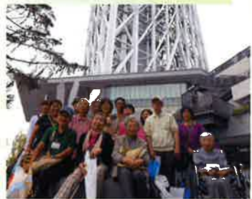
スカイツリー見上げて