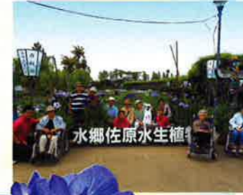
水郷あやめまつり