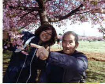
早咲き桜を目の前に