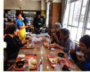
その場で揚げたて天ぷら