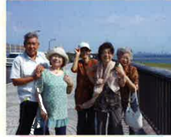
東京臨海ドライブ