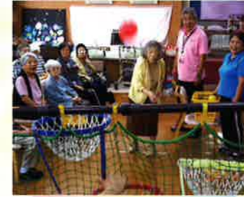
ナイス、ボールイン!