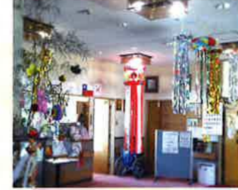
玄関前に七夕飾り