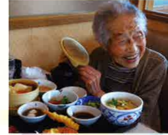
緑のカーテンにゴーヤ実る