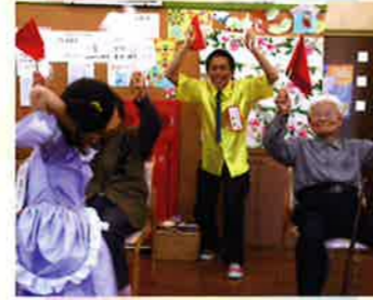
赤上げて、白上げて