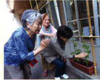
夏に向かい緑のカーテンを準備