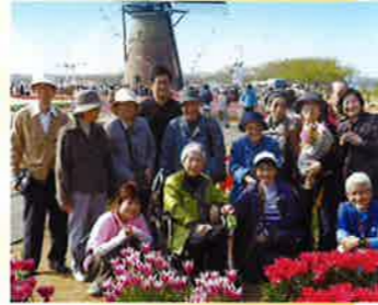
佐倉の名物・風車 風車を取巻くチューリップ