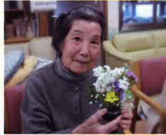
フラワーアレンジ