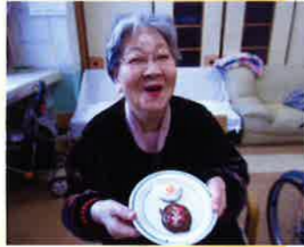
バレンタインデー