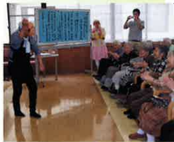
ボランティアの踊り