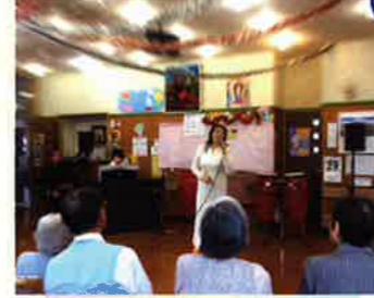
歌手のボランティア