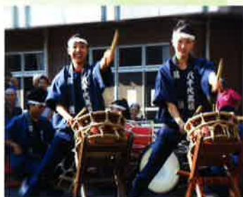
高校生の太鼓披露