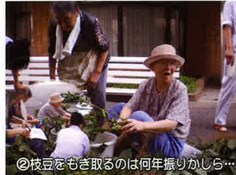
②枝豆をもぎ取るのは何年振りかしら...