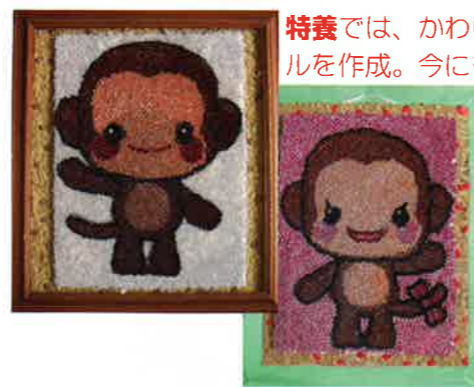
特養では、かわいいおサルのカップルを作成。今にも飛び出てきそうな感じです。なぜ、サル?? それは秘密で〜す。