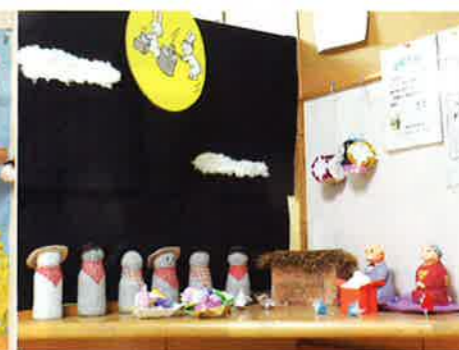
デイサービスの入口では、毎月色々な作品が皆様を迎えていますよ。

デイサービスでは、毎月様々なカレンダーや作品作りをしています。少々手間はかかりますが、完成した時の喜びは図り知れません……作り方は簡単なので、小さい作品から始めてみませんか?