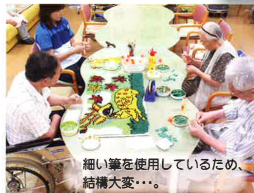
細い筆を使用しているため、結構大変・・・。