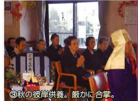
③秋の彼岸供養。厳かに合掌。