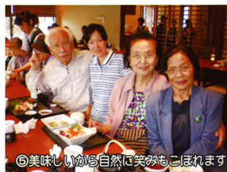
⑤美味しいから自然に笑みもこぼれます。