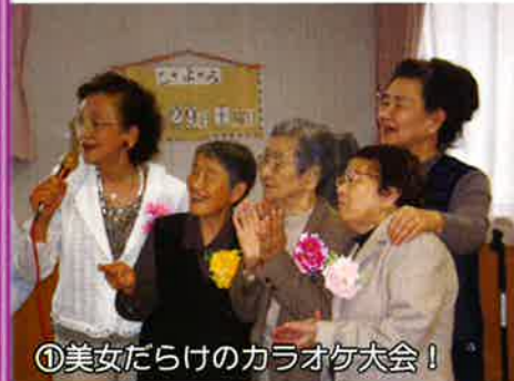
①美女だらけのカラオケ大会!