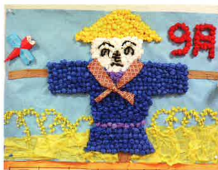
壁面大きな手作りカレンダー。デイルームに季節を感じさせます。