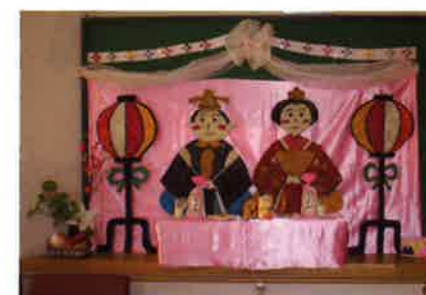
りんどうでは、お雛様を作成。どこが巻き絵か分かります??