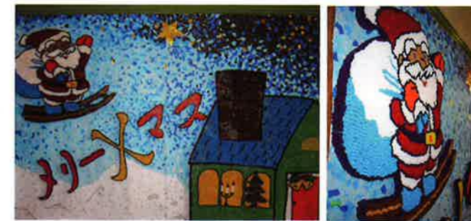
ガーデンカルミアではクリスマスの作品です。高さがあるので、かなり立体的なんですよ〜。