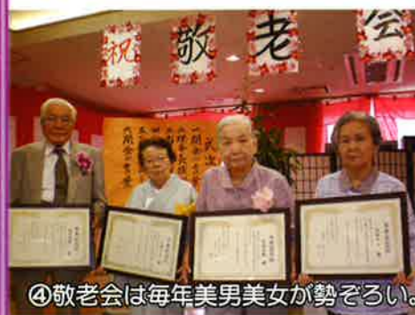
④敬老会は毎年美男美女が勢ぞろい。