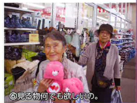
⑥見る物何でも欲しいの。