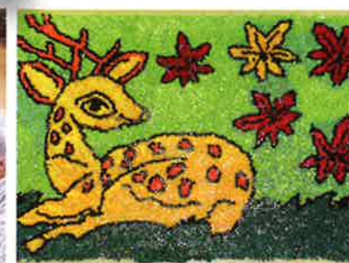
↑ついに、完成!!! 鹿も紅葉を見て秋を楽しんでいるようですね。